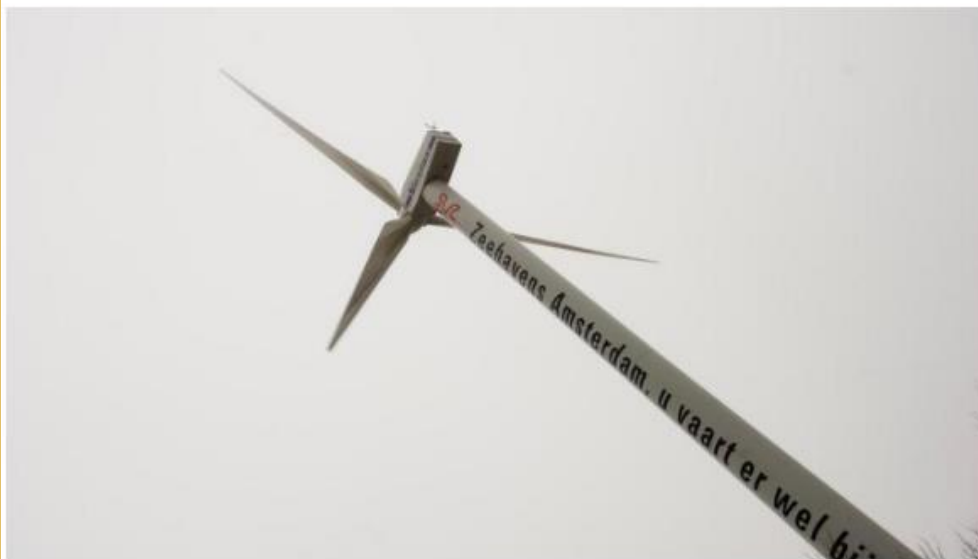
Een windmolen in het Westelijk Havengebied van Amsterdam met reclame voor de haven.